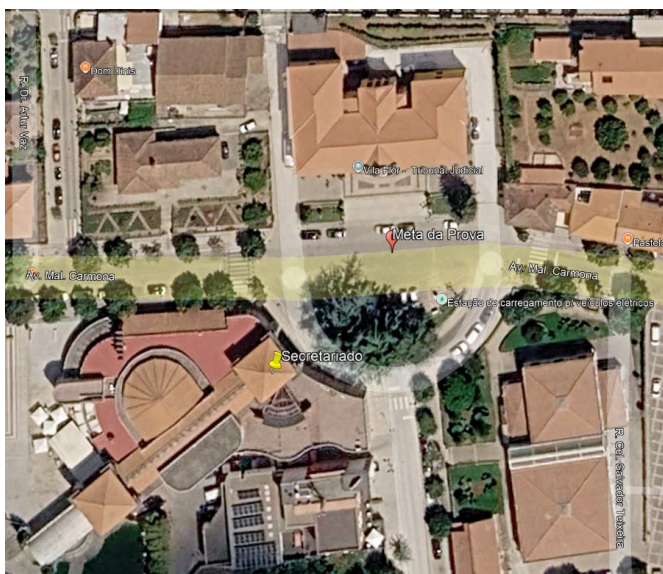
Secretariado e Meta da Prova

A competição irá realizar-se no concelho de Vila Flor, com partida no Santuário Nossa Senhora dos Remédios em Vilarinho das Azenhas e chegada na Avenida Marechal Carmona (em frente ao edifício municipal), onde também se localiza o secretariado.